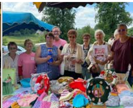
En collaboration avec la Rando St-Pa et dans le cadre d'« Octobre Rose », une tombola a été organisée en faveur de la Ligue contre le Cancer.