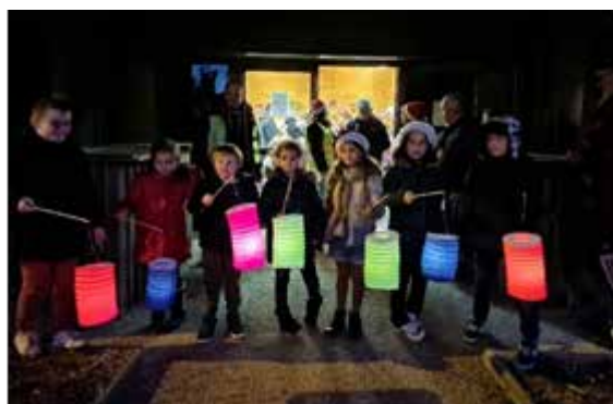
Retraite aux flambeaux pour les enfants et goûter.