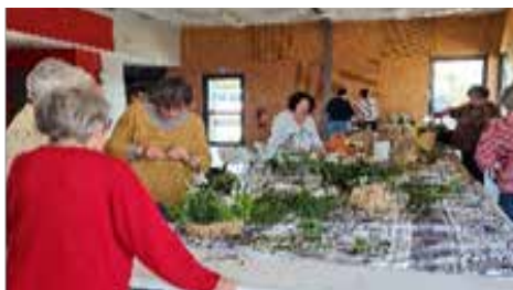
Nouveau : Atelier d'Art Floral