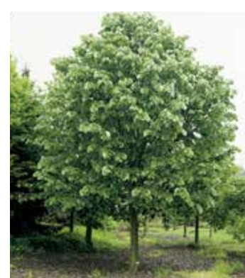
Tiliacolumna ou Tilleul argenté , ses bourgeons présentent des propriétés anxiolytiques et anti spasmodiques.