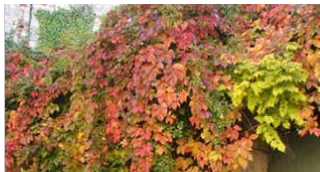
Vigne vierge de Virginie