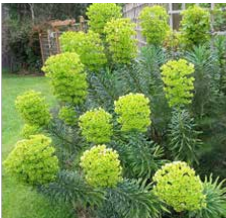
Euphorbe des Garigues