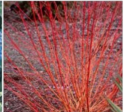
Cornus sanguinea « Magic Flame »