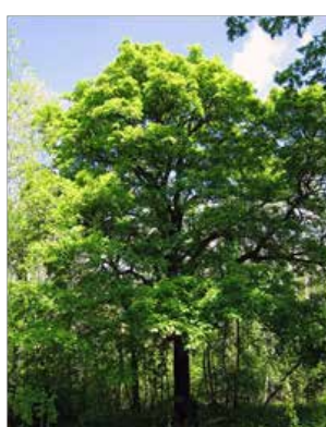
Sorbustorminalis ou Sorbier terminal , fleurit en , ses baies sont réputées pour leur capacité à traiter les coliques.