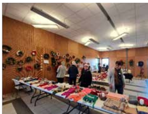
Vente des créations de l'année.