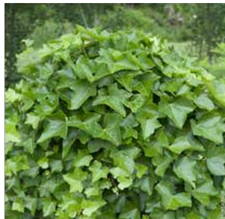
Lierre grim pant