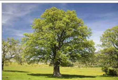
Quercus pyrenaea ou Chêne des Pyrénées , son écorce aurait des propriétés anti inflammatoires, hémostatiques, analgésiques, toniques et antioxydantes.