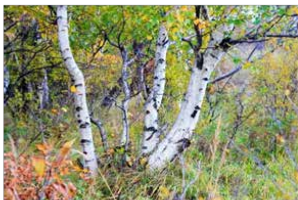
Betula alba en bouquet ou Bouleau blanc, très rustique, il peut atteindre 25 m de haut.