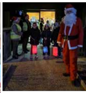
Visite du Père Noël.