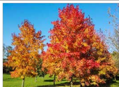
Liquidambar styraciflua Ou Copalm d'Amérique , très décoratif, son feuillage est vert puis cuivre, or et pourpre, sa résine possède des propriétés dermatologiques.