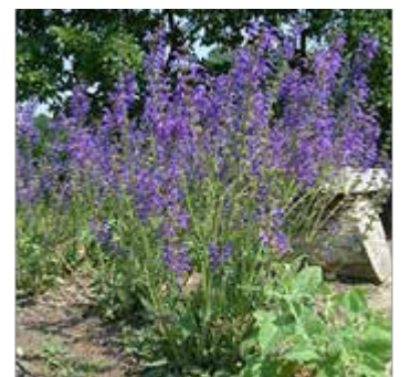
Saug e officinale