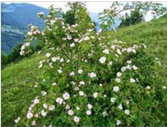
Rosa canina – Rosiers des chiens