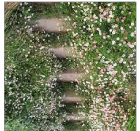
Paquerettes des murailles