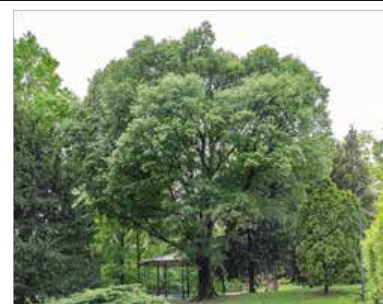
Celtis australis ou Micocoulier de Provence , son fruit est comestible au goût de pomme caramélisée, en Provence on en fait des confitures.