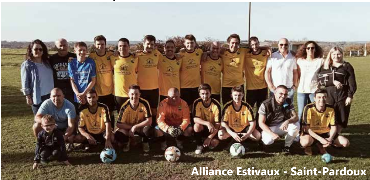
Alliance Estivaux - Saint-Pardoux