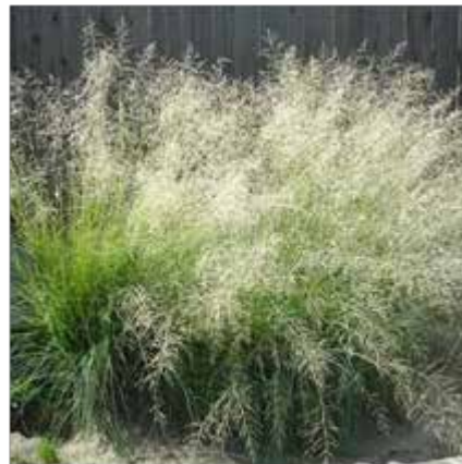
Eragrostis – Herbe bleue